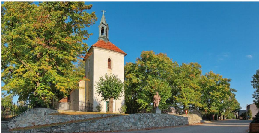
Ratměřice – Vesnice roku 2010

Novinkou letošního ročníku je převedení koordinace a organizace jednotlivých krajských kol soutěže pod správu Centra pro regionální rozvoj ČR (CRR) – příspěvkové organizace Ministerstva pro místní rozvoj ČR (MMR). Zástupci CRR tak letos poprvé vykonávali funkci krajských tajemníků a všechny přihlášky proto směřovaly právě do jejich rukou. Díky dlouhodobé spolupráci s Centrem pro regionální rozvoj ČR má naše redakce k dispozici aktuální a podrobné údaje o letošní účasti.