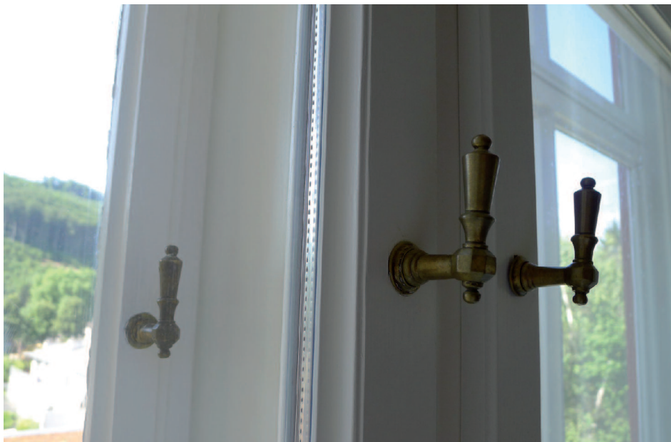
Vložení dvojskla do vnitřního rámu dvojitého okna je technicky méně příznivé, ale možné a efektivní.

Georg Reinberg: Purkersdorf, 2009, Rakousko.