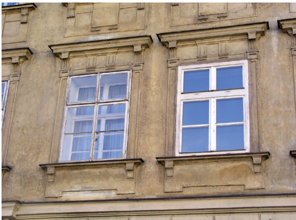
Obě okna jsou dřevěná a mají „stejně“ členění. Opravdu jsou stejná? Snímek ilustruje důsledek omezení otázky vzhledu okna pouze na materiál a členění.

Národní památkový ústav vyjádřil svůj názor na požadavek šetřit energií společným prohlášením s Českou komorou architek-