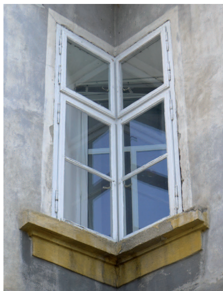
Hodnota architektonického dědictví je mimo jiné v tom, že je jiné než to, co nabízí naše doba. Pokud rezignujeme na jeho ochranu, bude náš život chudší.