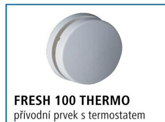
FRESH 100 THERMO přívodní prvek s termostatem