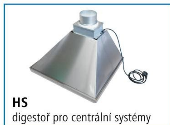
HS digestoř pro centrální systémy