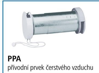
PPA přívodní prvek čerstvého vzduchu