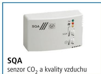
SQA senzor CO 2 a kvality vzduchu