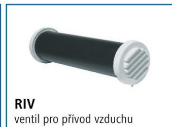
RIV ventil pro přívod vzduchu