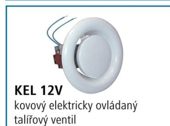
KEL 12V kovový elektricky ovládaný talířový ventil