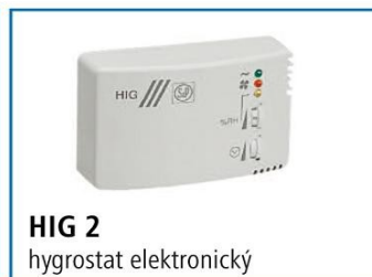
HIG 2 hygrostat elektronický