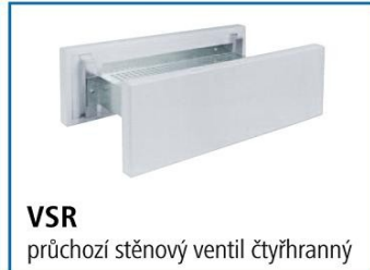
VSR průchozí stěnový ventil čtyřhranný