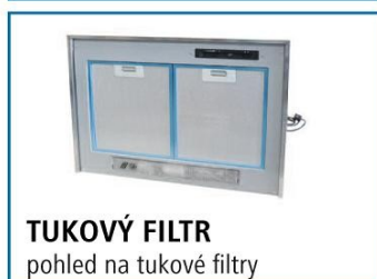
TUKOVÝ FILTR pohled na tukové filtry