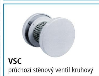
VSC průchozí stěnový ventil kruhový