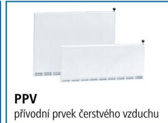
PPV přívodní prvek čerstvého vzduchu