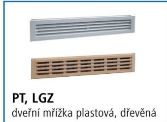
PT, LGZ dveřní mřížka plastová, dřevěná