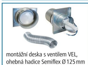
montážní deska s ventilem VEL, ohebná hadice Semiflex Ø 125 mm