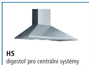
HS digestoř pro centrální systémy