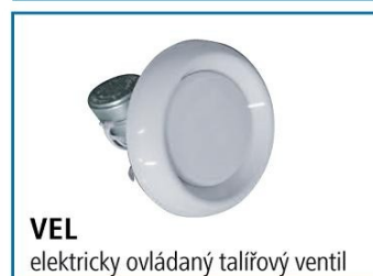
VEL elektricky ovládaný talířový ventil