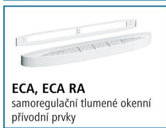
ECA, ECA RA samoregulační tlumené okenní přívodní prvky