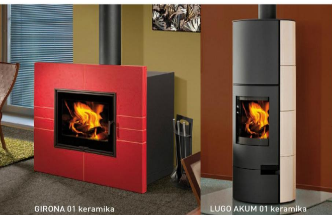
GIRONA 01 keramika