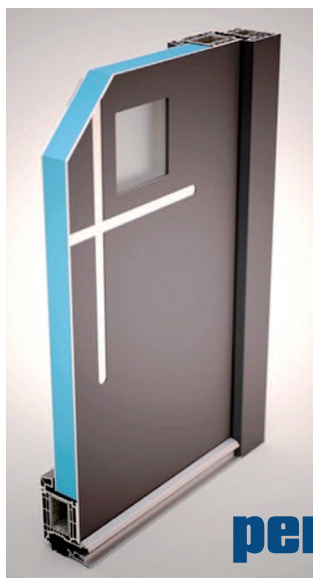
Technologie překrytí křídla u dveřní výplně GFK

Prvním rozdílem je skladba výplně . Tu tvoří povrchové desky z materiálu GFK neboli ze speciálního sklolaminátu , který je velmi pevný a odolný (podobný materiál se využívá